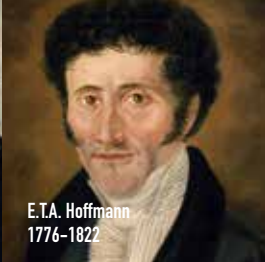
E.T.A. Hoffmann 1776-1822