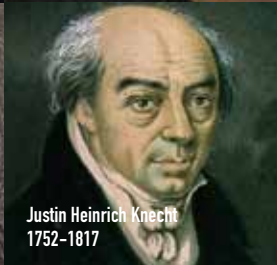
Justin Heinrich Knecht 1752-1817