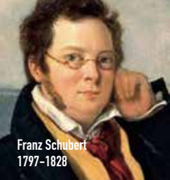
Franz Schubert 1797-1828