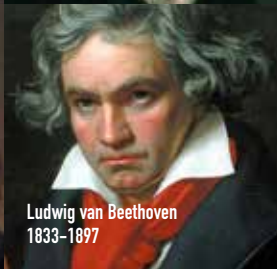
Ludwig van Beethoven 1833-1897