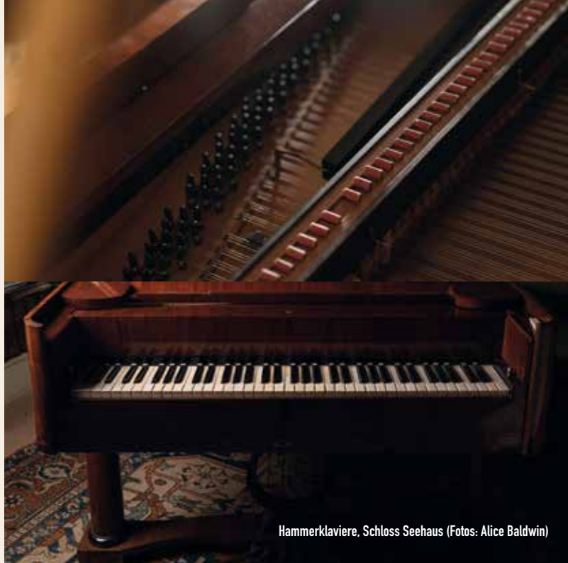
Hammerklaviere, Schloss Seehaus

Anmeldung mit Angaben zu Repertoire und dem jeweiligen Trio erbeten unter: chambermusic@schloss-seehaus.de .