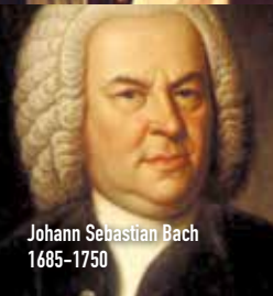
Johann Sebastian Bach 1685-1750