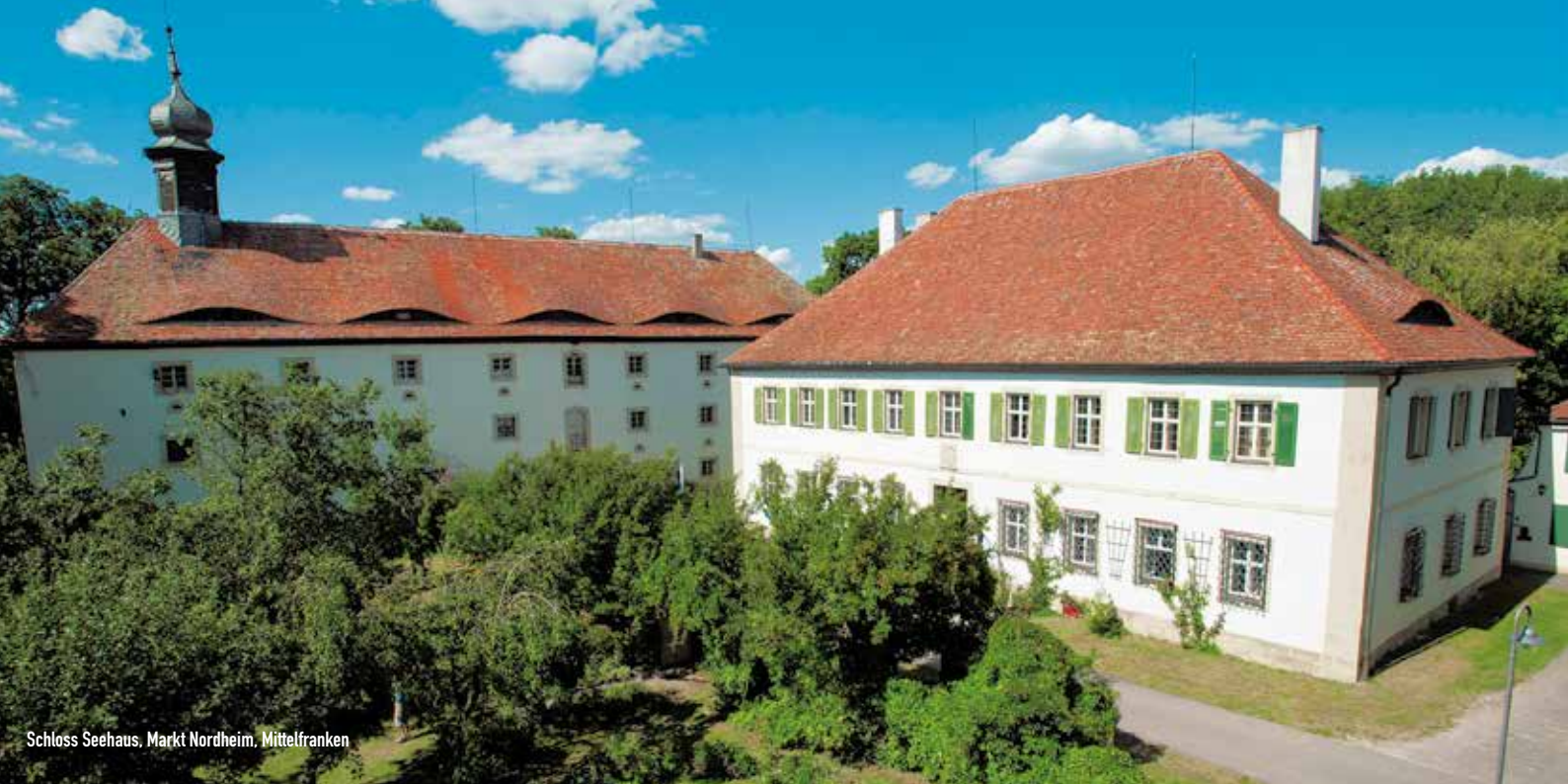
Schloss Seehaus, Markt Nordheim, Mittelfranken