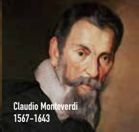
Claudio Monteverdi 1567-1643