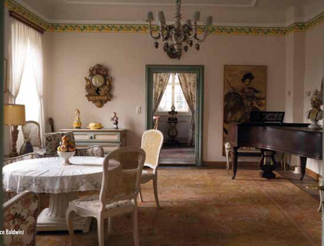
Musikzimmer im Haupthaus