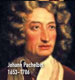
Johann Pachelbel 1653-1706