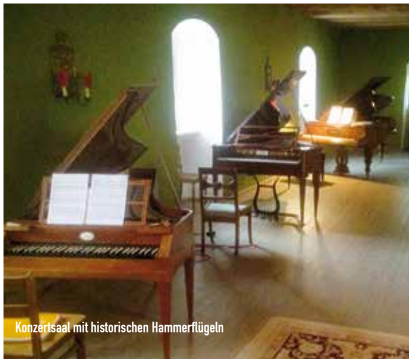
Konzertsaal mit historischen Hammerflügeln

Freier Eintritt. Spenden für Schloss Seehaus e. V. erbeten.